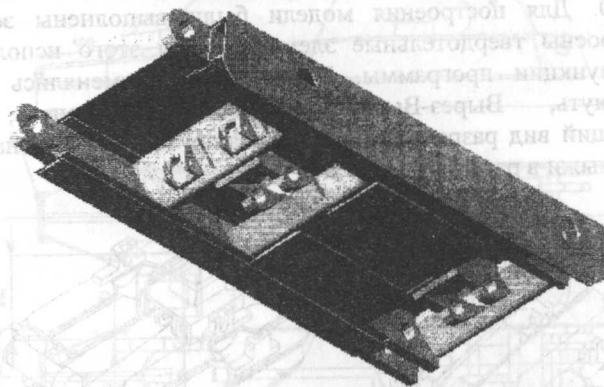
Рис.1. Твердотельная модель сборки перекрытия

деформирования), либо диаграмма зависимости напряжений от деформаций (для других видов деформирования).