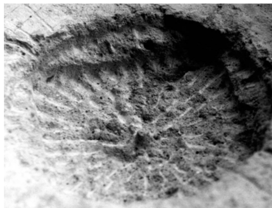
Рис. 4. Вид скважины сбоку