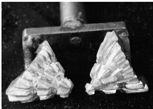
Рис. 1 Опытный образец двухшарошечного долота