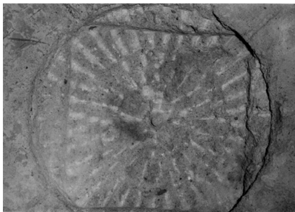
Рис. 3. Вид скважины сверху

Процесс забурирования проходил в следующей последовательности. Вначале происходило образование конусной поверхности забоя круглого сечения. При бурении первого блока происходило налипание мелочи на межзубцовое пространство шарошки, образовывалась слабовыраженная забойная рейка. Тоже происходило при бурении второго блока в условиях недостаточной очистки забоя. После образования конусной поверхности забоя на полный диаметр (160 мм) в результате несинхронного движения шарошек и образования к этому времени более выраженной периферийной рейки бурение прекращалось, после подъема долота над забоем шарошки ориентировались и устанавливались на забой как показано на