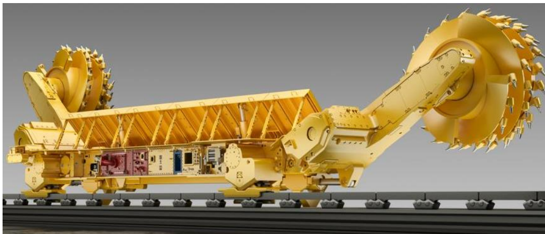
Рисунок 1 – Очистные комбайны фирмы Joy (а) и Eickhoff (б)

В таблице 2 представлен обзор, показывающий изменение мощностей приводов резания очистных комбайнов и длин лав начиная с 1960 года [1–6].