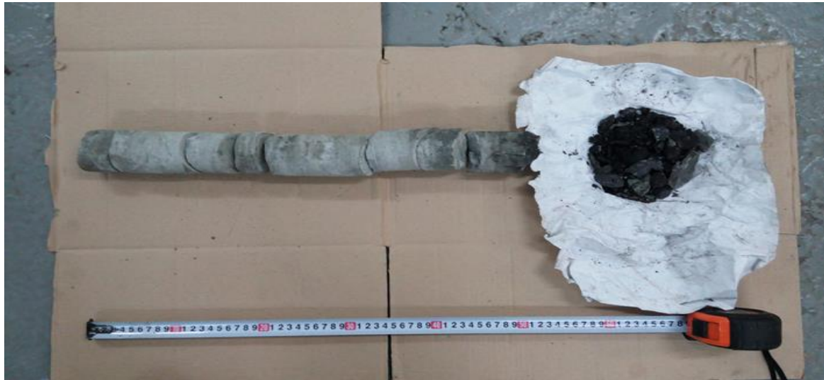
Рис. 3. Проникновение цементирующего раствора в углеродный массив