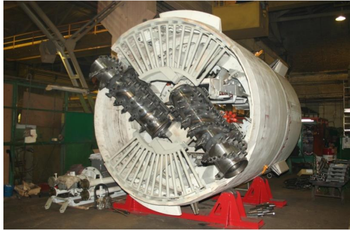
Рисунок 1. Опытный образец ПА модели «401» диаметром 3,2 м

Основными элементами и системами ПА класса «геоход» являются: