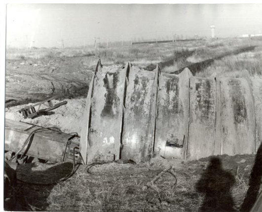
Рис. 2. Натурные испытания ВПА «ЭЛАНГ-3» Fig. 2. Field tests of the first sample of the geohod