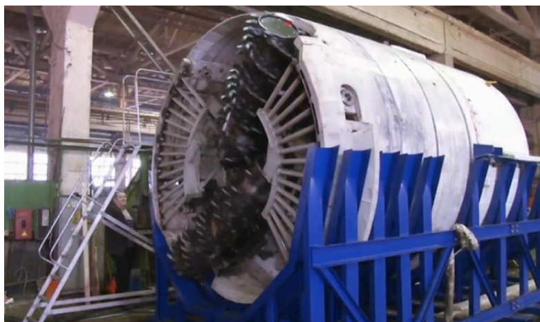
Рис. 3. Стендовые испытания геохода модели «401» Fig. 3. Bench tests of the GEOHOD MODEL «401»

Авторы считают, что применение данных методов исследований позволит получить необходимый объем