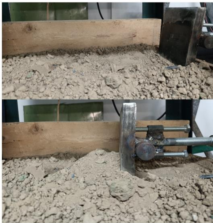
Рис. 6. Стенд для моделирования условий движения бурового става в массиве грунта Fig. 6. A stand for modeling the conditions of movement of a drilling rig in a soil mass