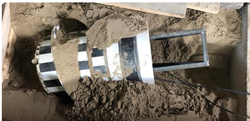
Рис. 5. Испытания демонстрационного образца геохода Fig. 5. Testing of a prototype geohod in loose soil